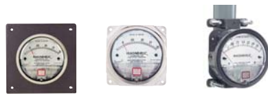
encastré ...en saillie...ou sur conduite

Montage. Boîtier de taille unique. Ø de perçage 115mm. Le magnehelic peut être monté encastré ou en surface en utilisant le kit de montage fourni.